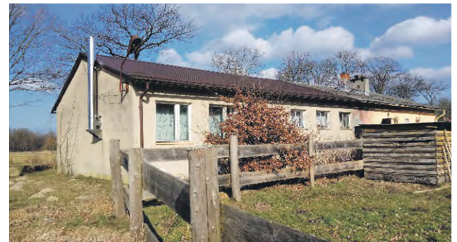
Budynek w miejscowości Żelimucha