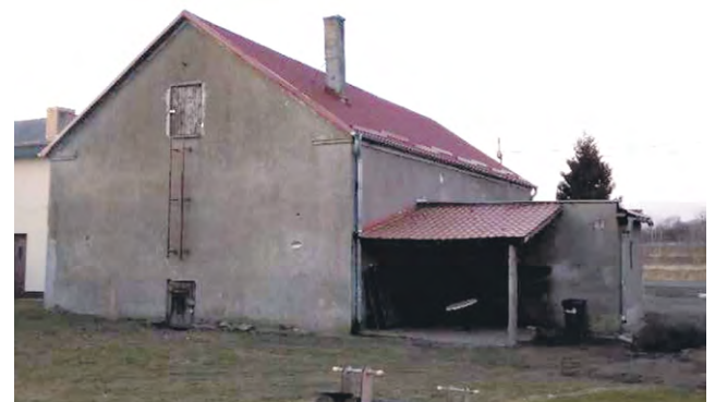
Budynek w miejscowości Buczek